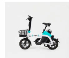
電動アシスト自転車